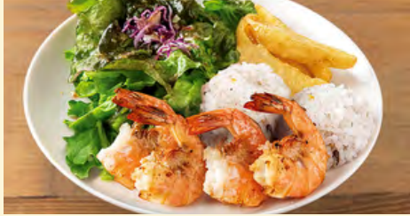
シンプル シュリンプ