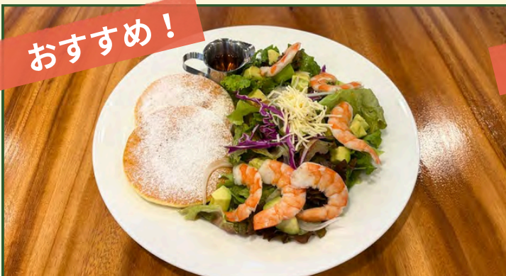
海老とアボカドのサラダパンケーキ