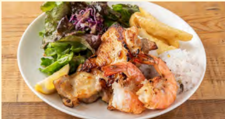
シュリンプ チキン