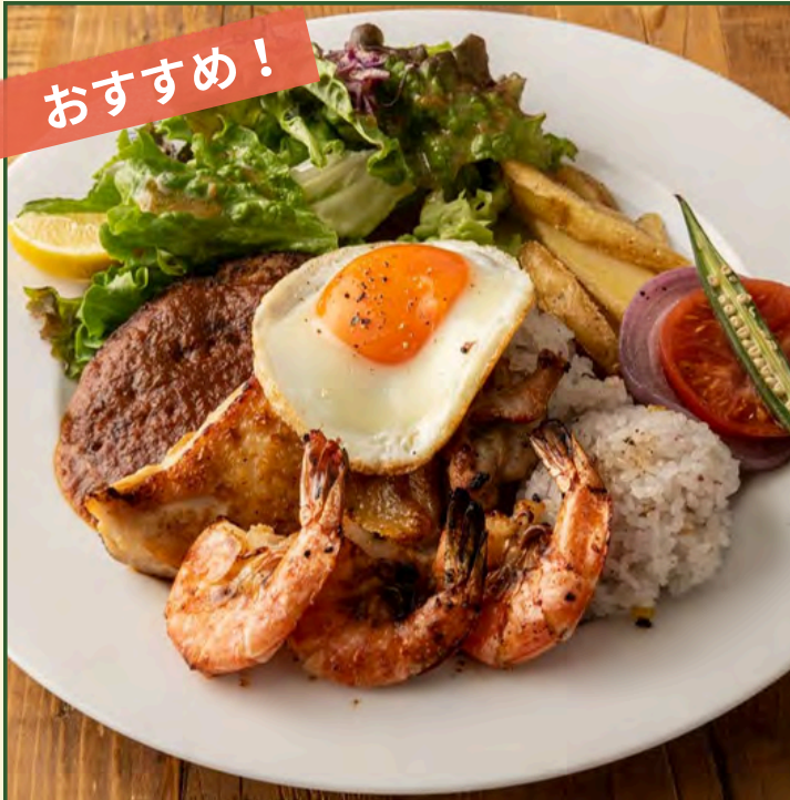
ミックスプレート