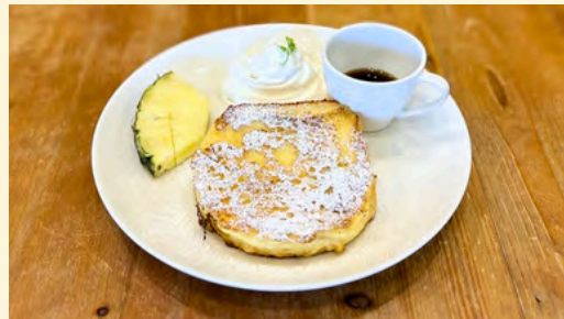
フレンチトースト1枚