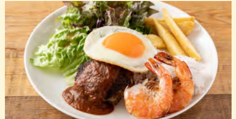
シュリンプ ロコモコ