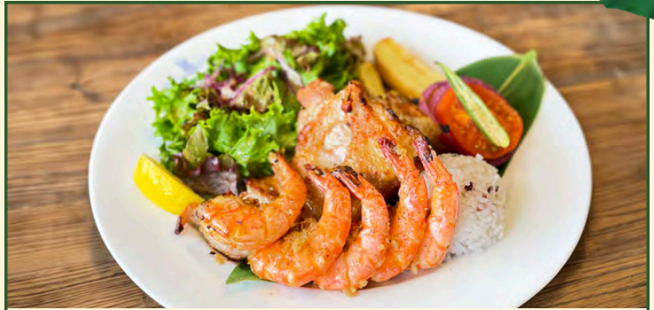
ガーリックシュリンプ&チキンプレート