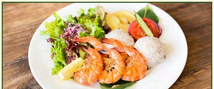
ガーリックシュリンププレート