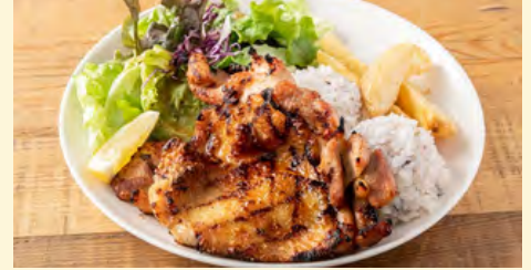
シンプル グリルチキン