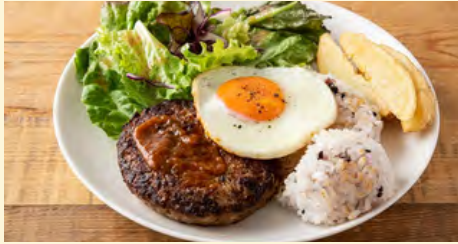
シンプル ロコモコ