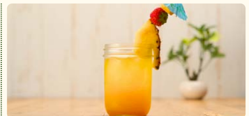
アイランドフルーツクーラー