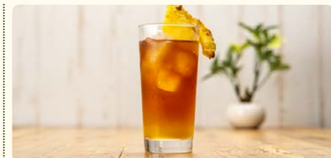
プランテーション アイ스티ー