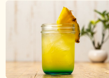
ハワイアンブルー