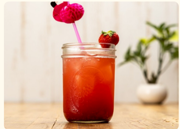
ストロベリーピンク