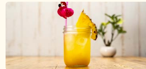
パッションサンライズ