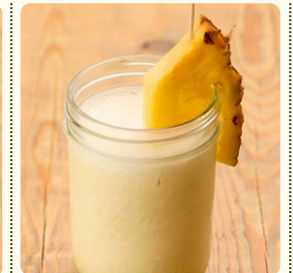
パイナップル スムージー