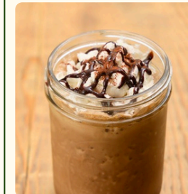
ダブルエスプレッソ モカスムージー