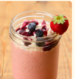
ベリーベリー ヨーグルトスムージー