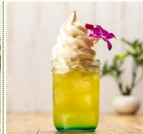
ハワイアン ブルーフロート