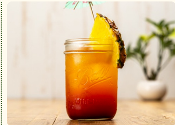
サンセットビーチ