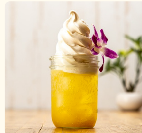
パッション サンライズフロート